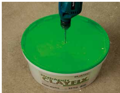
Bei geschlossenem Deckel einmischen