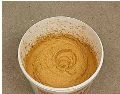
Nach 30 Minuten kräftig durcharbeiten, das Bild zeigt die verarbeitungsfertige Konsistenz