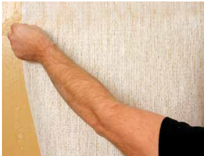
Aufkleben der Glasgewebetapete

Auch für Glasgewebetapeten kann CLAYFIX Lehm-Anstrich eingesetzt werden. Sie ist dabei Klebung und Anstrich in einem, beide Funktionen werden mit einem Arbeitsgang erreicht, frisch-in-frisch ausgeführt. Handelsübliche Dispersionskleber sperren die Untergründe mehr oder weniger ab, mit Lehmfarbe bleiben die Wände diffusionsoffen.