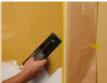
Auftrag der zweiten Farbe