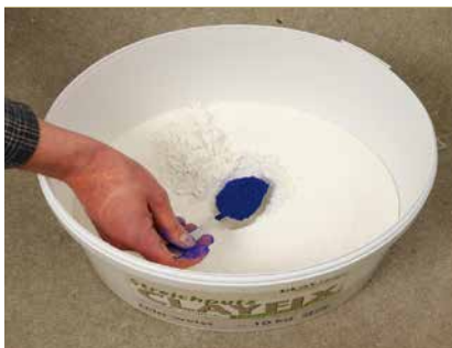
Pigment trocken zugeben