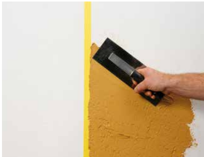
Auftrag der ersten Farbe an das Klebeband

Anders als andere Farbtöne kann YOSIMA WE 0 nach dem Trocknen nicht nur mit einem weichen Schwamm, sondern auch mit einem orangenen Schwamm-brett freigewischt werden. Bei diesem Arbeitsgang kann die Fläche sogar noch nachgerieben werden.