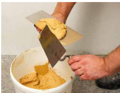
Entnehmen des Mörtels

Der Mörtel kann auch mit der Maschine angespritzt werden. Meist beschränkt sich das Anspritzen auf die Erleichterung des Mörtelantrags. Informationen und Kontaktadressen diverser Hersteller bietet unsere Internetseite www.claytec.de/service/maschinentechnik . Die dort genannten Ansprechpartner haben unsere Produkte mit den jeweiligen Maschinen im Praxistest erprobt und bieten somit kompetente Beratung.