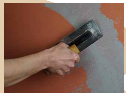
Auftrag der marmorierten Decklage