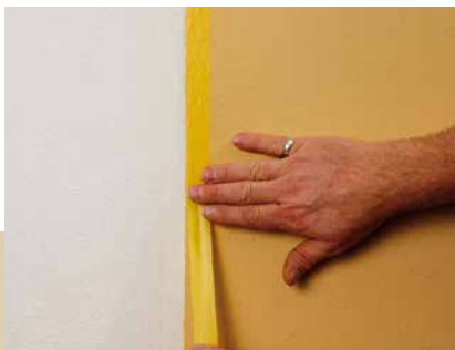
Erneutes Abkleben nach Trocknung