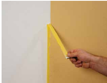
Abziehen nach dem Abwischen