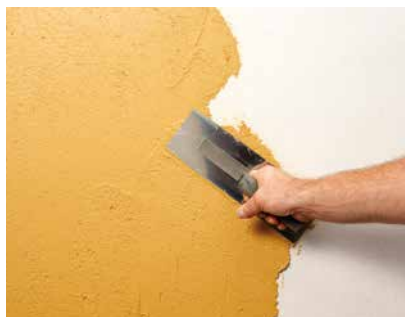
Aufziehen mit dem Glätter